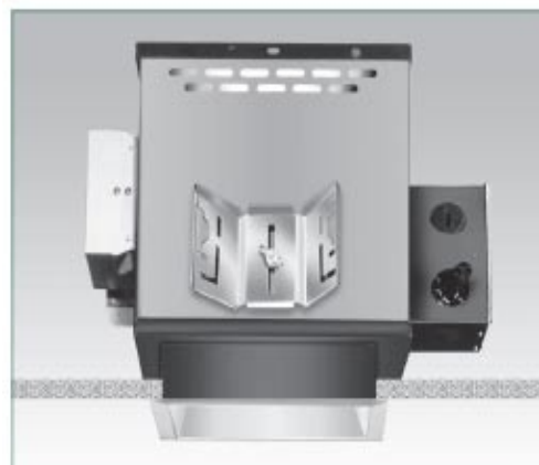
Dimensions and Lamps